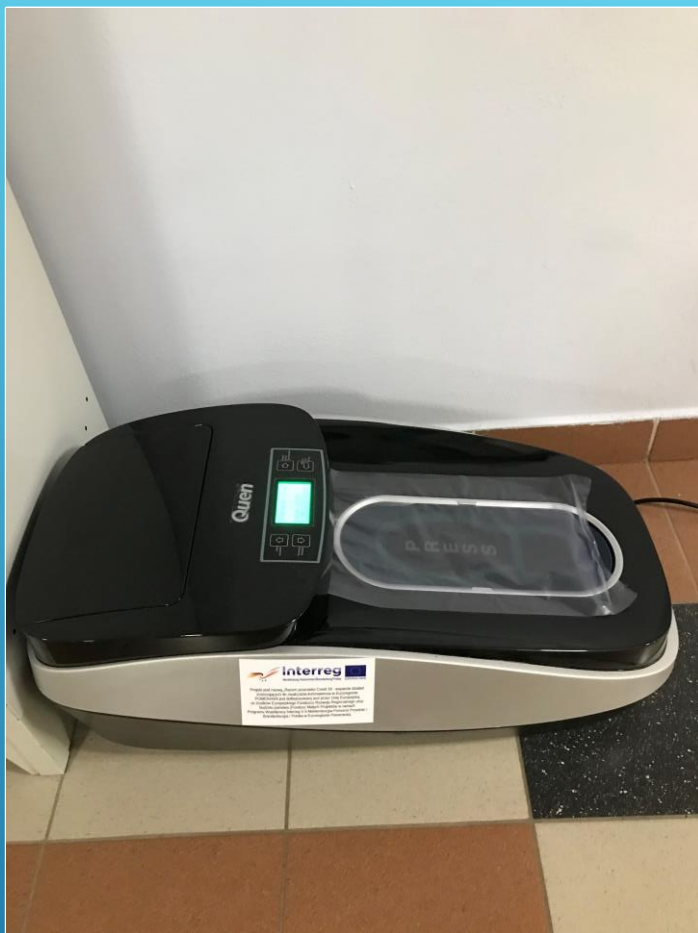
foliarka do butów (galomat) / Schuhfoliemaschine (Galomat)