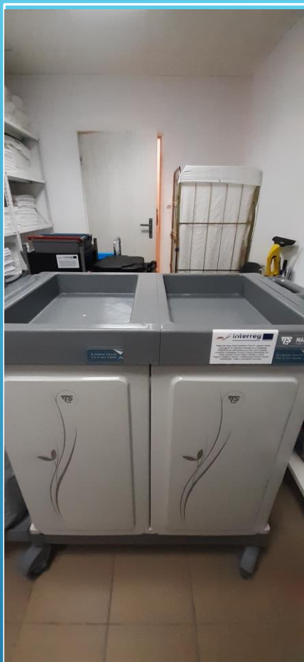
Wózek do sprzątania / Reinigungswagen