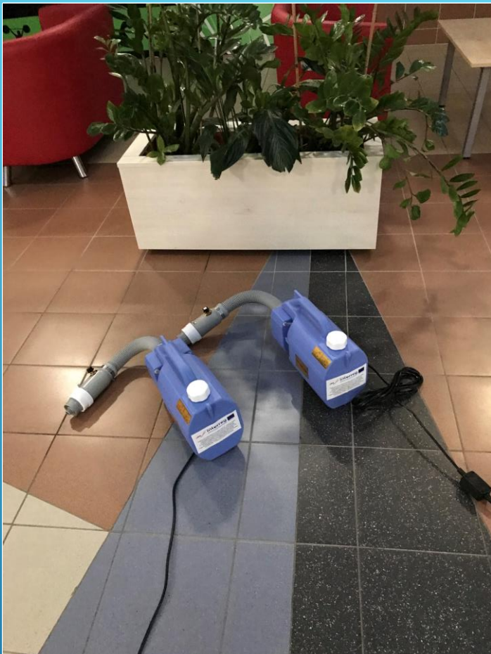
Zamgławiacz (do dezynfekcji) 2 sztuki/ Nebelmaschine - 2 St.