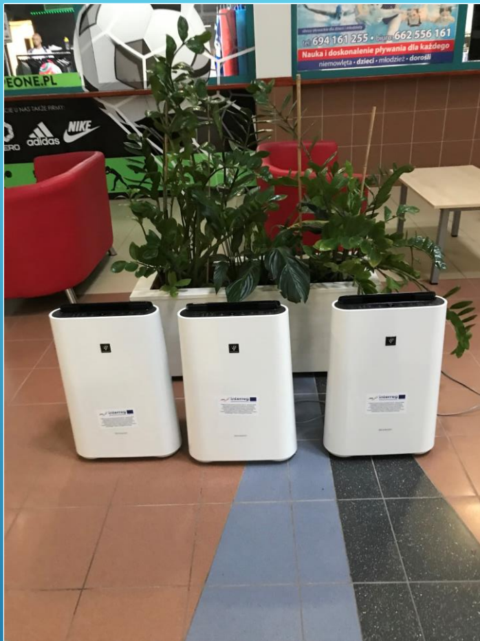
Oczyszczacz powietrza - 3 sztuki/ Luftfilter - 3 St.