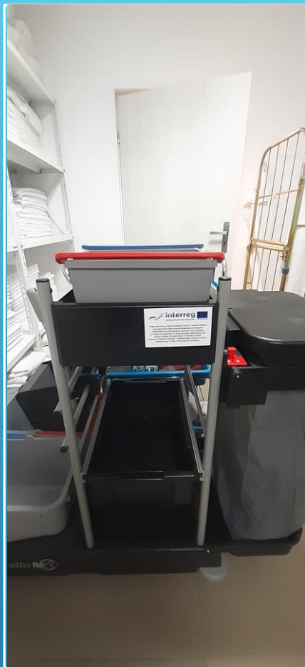
Wózek do sprzątania / Reinigungswagen