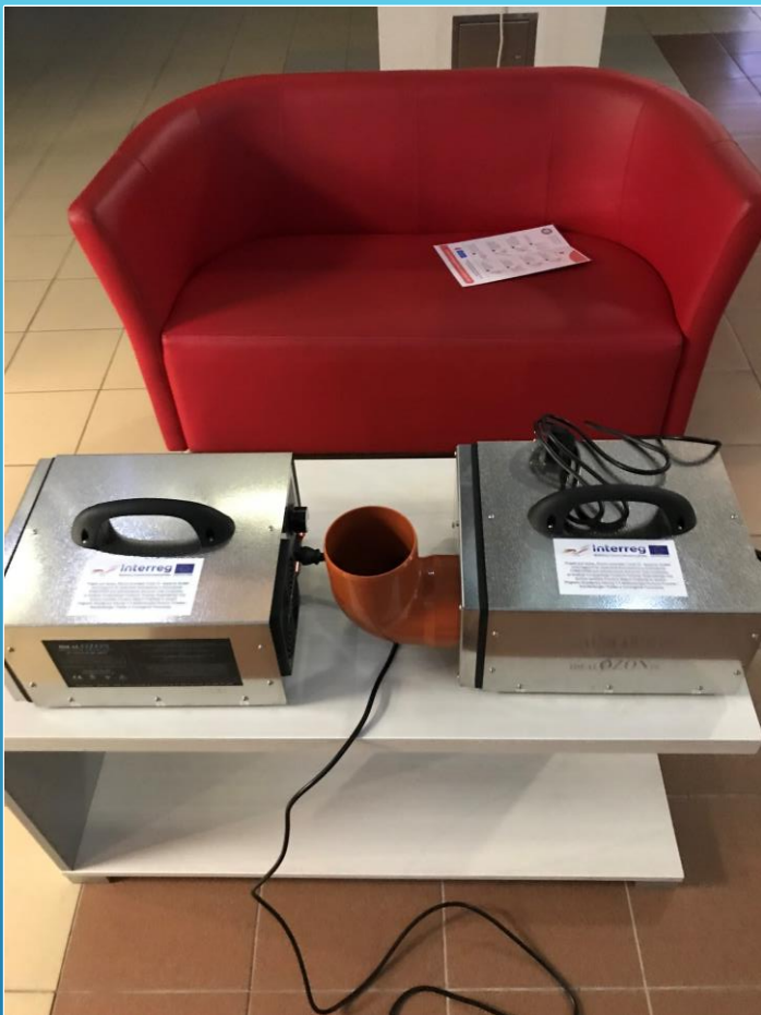
ozonator kwarcowy - 2 sztuki Quarzozonator - 2 St.